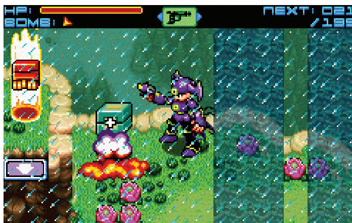
FA Die Oberwelten der sechs Planeten sind in Abschnitte unterteilt: Die Anhöhe mit dem Waffenextra erreicht Ihr über einen versteckten Pfad in einem anderen Sektor.

Undercover in der Alienflotte: Elitepilot Ian Recker schusselt sich durchs Sonnensystem.