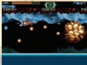
GBA An Bord Eures Jägers sichert Ihr den Luftraum (oben), die Raumstation der Aliens (rechts) dient dem Helden als Basis.

Die beiden Spielmodi ergänzen sich zu einem abwechslungsrei-